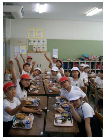
運動会応援給食 9月22日