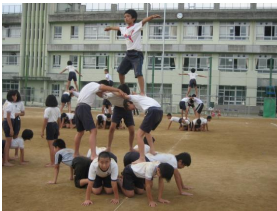
運動会練習の様子（6年生）